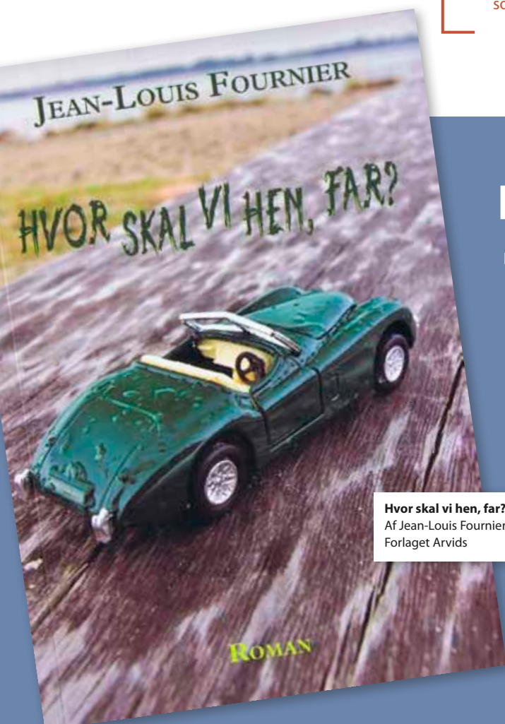
Hvor skal vi hen, far? Af Jean-Louis Fournier Forlaget Arvids