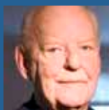
Palle Simonsen (K), tidligere socialminister og formand for Det Centrale Handicapråd