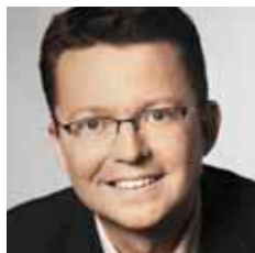
AF ANNE BAASTRUP, FOLKETINGSMEDLEM (SF) OG RENÉ SKAU BJÖRNSSON, FOLKETINGSMEDLEM (S)