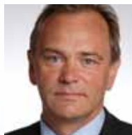
Jan Trøjborg, formand i KL