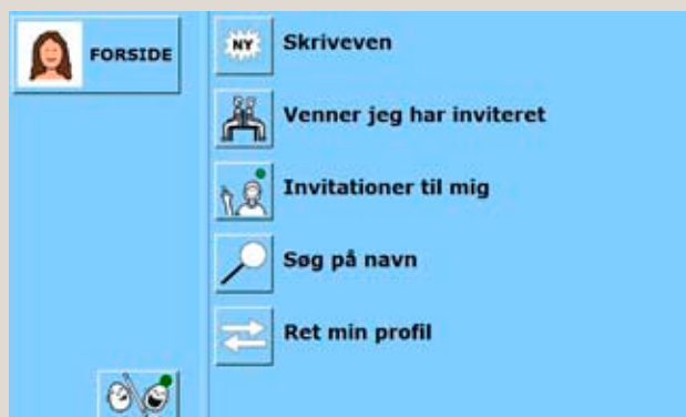
Kig i skrivevenner.

Men programmet er ikke altid nok i sig selv. Det kan være svært at bruge Herbor kontinuerligt, hvis skiftende pædagoger ikke har kompetencerne eller interesserer sig for det. Et forældrepar deltager for at genoptage brugen af Herbor efter en periode, hvor deres søn har haft pædagoger, som ikke havde forudsætningerne for at støtte sønnen. Han har netop