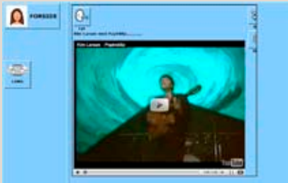
YouTube i Herbor.

Derfor søger man viden om Herbor... En lille gruppe pædagoger fra et botilbud vil gerne have mere indsigt, da beboerne bruger det. Én er blevet støtteperson for en person, der har Herbor, så hun vil gerne lære om det.