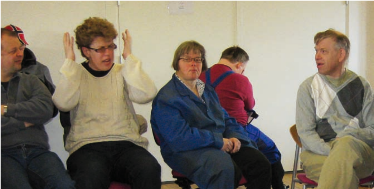
Open Space-metoden er med til at give både viden og sjove ideer.

på de beskyttede værksteder udvikles der i SMUT flere former for materialer. Eksempelvis en internetportal, hvor medarbejderne kan indskrive deres målsætninger enten via ikoner eller tekst. Det bliver kombineret med små internetbaserede konkurrencer, hvor man dystet mod sig selv i emnerne kost, motion og sundhed/sygdom, hvor den enkelte får medalje for rigtigt svar.