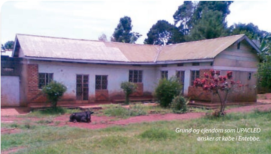
Grund og ejendom som UPACLED ønsker at købe i Entebbe.

UPACLEDs kontorer er i dag lejede lokaler, hvor lejen stiger år for år. Det er helt uholdbart for UPACLEDs fortsatte arbejde. Så det er en nødvendighed for UPACLED at finde nye lokaler. Stedet, UPACLED har fundet, ligger i Entebbe, der er omkring en times kørsel fra hovedstaden Kampala. Grunden med en bygning på, der trænger til lidt renovering, koster inklusiv renovering 160.000.000 UGX, hvilket svarer til omkring 450.000 kr.