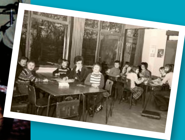
Vestermarkskolen i dag og for 35 år siden. Der er sket meget siden dengang, der ikke var farve på billederne. Begge billeder viser, at ingen er u-underviselige, men de pædagogiske metoder er udviklet en del i løbet af de seneste årtier. Artiklens forfatter ses længst th. på det sort/hvide foto.

"Nu må det imidlertid ikke overses, at når det gælder undervisning af de allerdårligst fungerende børn – "de vegetative" eller "vandrette", som de ikke sjældent betegnes – er det ikke blot kvantitative muligheder, der fordres. En sådan undervisning kræver en helt speciel faglig, pædagogisk viden, som endnu – meget forståeligt – er en mangelvare i pædagogikorpset. Et virkelig kvalificeret undervisningstilbud til disse børn forudsætter, at der er et personale, der kan effektuere det. Der er derfor hårdt brug for en intensiv videreuddannelse inden for de personalegrupper, som vil blive impliceret i dette arbejde."